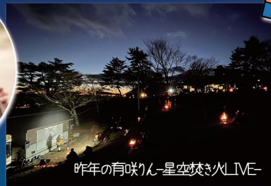
昨年の有咲りん-星空焚き火LIVE-